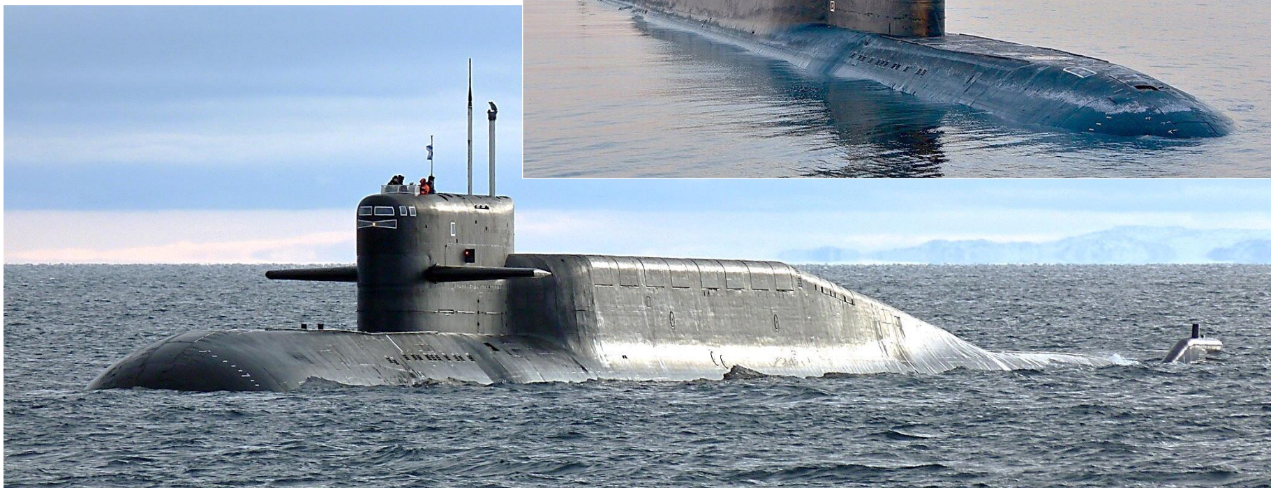
Основные тактико-технические элементы

КОРАБЛЕСТРОИТЕЛЬНЫЕ ЭЛЕМЕНТЫ – 11740 / 18200 т, 167,4×11,7×9,0 м, 2 АР, 2×20000 л. с., 2×306 л. с., 2 ВФШ, 15,3 / 24,0 уз, неограниченная миль, 320 / 400 м, 90 суток, 135 человек. ВООРУЖЕНИЕ – 16×1 ПУ РК Д-9РМУ2 "Синева" / Д-9РМУ2.1 "Лайнер" (16), 8×1 ПЗРК 9К333 "Верба" (16), 4×1 533 мм НТА (12 – Т / РТ / СГАПД). ДОПОЛНИТЕЛЬНЫЕ СВЕДЕНИЯ. Третий заказ в серии из 7 ед. ("К-64") переоборудован в ПЛАСН по пр. 09787.